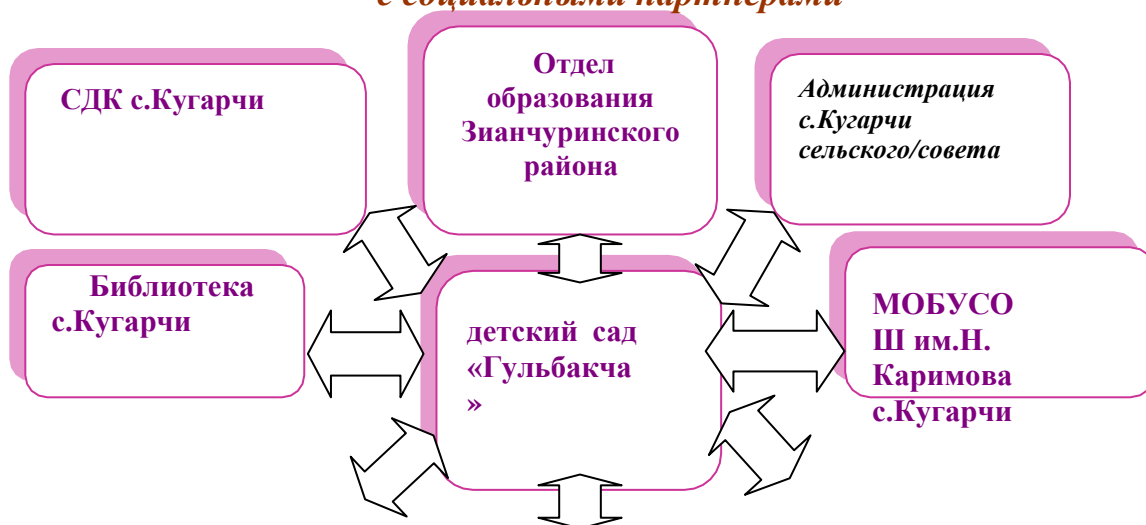
Схема взаимодействия филиала МОБУ СОШ им.Н.Каримова с.Кугарчи д/с «Гульбакча» с социальными партнерами